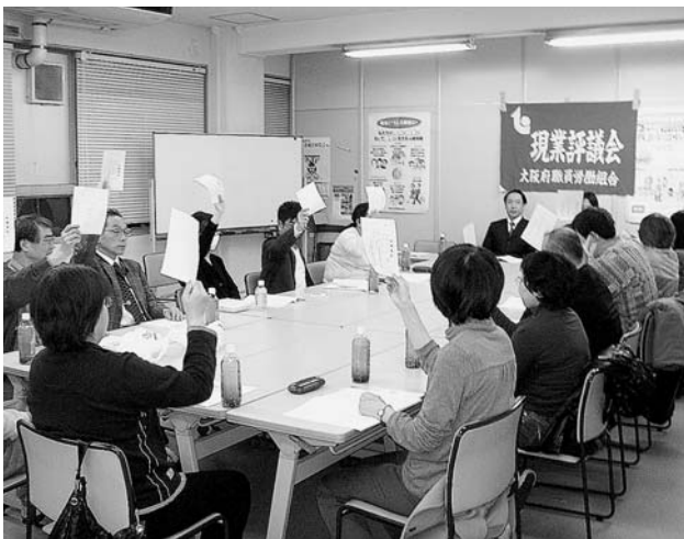
現業評議会 第46回定期大会

3月25日(水)、現業評議会は第46回定期大会を開き、議決事項として、現業職場を中心に「休暇が取りづらくなる、出先の少人数化がすすむ、雇用の抑制により、退職後の不補充や業務の委託がすすむ」といった声があがりました。