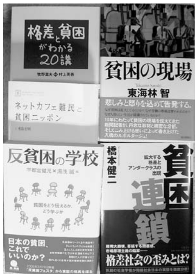
写真は、「貧困」をタイトルにした書籍。これ以外にも発行されている。

浅川監督の暴力、非道さが、「蟹工船」の酷さを印象づけている。ところが浅川監督は、朝一番に起きて漁夫たちを叩き起こし、夜は夜で皆が寝静まった頃に逃亡者がいな