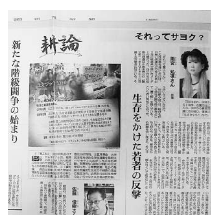
写真は若者の反撃を伝える「朝日」(08年5月18日)の記事

「朝日」6月5日。大阪でも、NTTユニケーションズを二重派遣の疑いでは正指導(MBS毎日放送ニュース)。そんな中で、直接雇用を勝ち取った経験も生ま