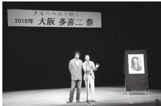
大阪多喜二祭の漫才風景