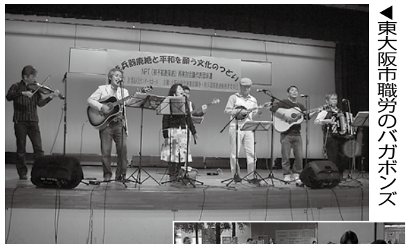
東大阪市職労のバガボンズ

病院職場で3交替勤務の中で、参加を決意してくれうれしく思います。出産という本来なら喜ばしい職場で、高度専門医療を行っている母子センターではつらい、悲しいことも多いです。患者さんに寄り添う看護をするには、人間として