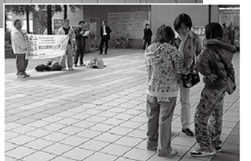
京橋でアピール署名宣伝行動