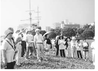
昨年の平和友好祭