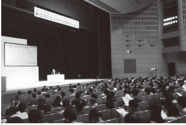
第11回 地方自治研究全国集会 in 埼玉

オスプレイ配備撤回 大阪府民集会 10月23日(火) 18時30分より 扇町公園