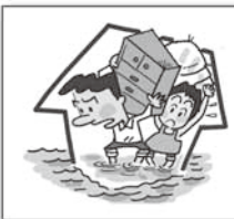
洪水で床上浸水となった