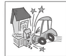
他人の車が飛び込み、門がこわれた

火災共済がカバーするのは火事だけではなく、実は保障しているケースが意外に多いのが「落雷」! 落雷でパソコンが壊れたなどの家電製品への保障です。身近な事故を保障する火災共済には加入しておきましょう。