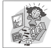
泥棒の侵入でドアや家具を壊された (5万円以上の損害の場合)