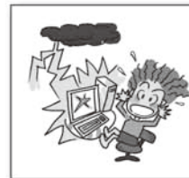
落雷でパソコンなど家電製品が故障した