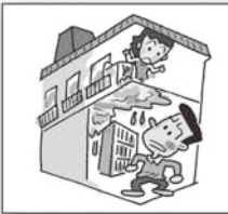
上階の他人の居室からの漏水で、壁にシミが生じた