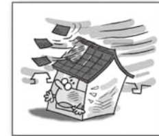
台風で屋根瓦が飛ばされた (10万円以上の損害の場合)