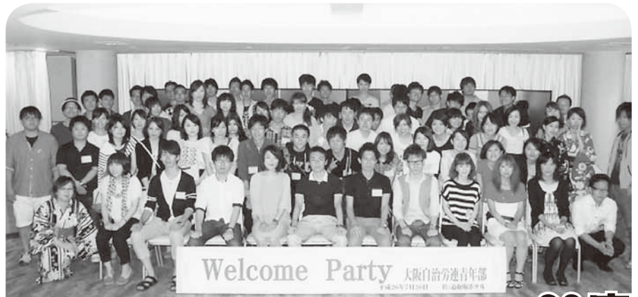
大阪自治労連青年部