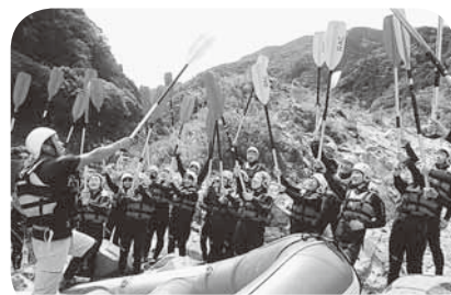
いよいよラフティングへ。参加者みんなで「がんばるぞー」

9月20~21日、府職労ラフティングツアーを徳島県吉野川で開催しました。吉野川は利根川(坂東太郎)・筑後川(筑紫次郎)と並び「四国三郎」の異名をもつ日本三大暴れ川の一つであり、一級河川ではもっとも水がきれいな川とも言われています。風が少し冷たくなりつつある時期でしたが、ラフティングに臨んだ21日はいい天気に恵まれ、絶好のラフティング日和となりました。