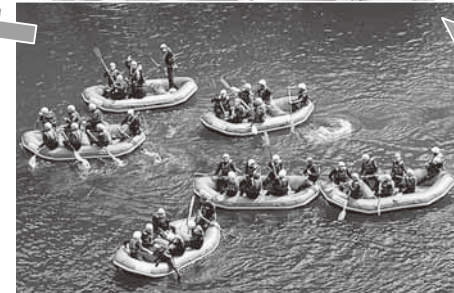
雄大で美しい川に浮かんで気分爽快