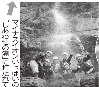
「あわせの滝」に打たれてマナーサインいっぱい