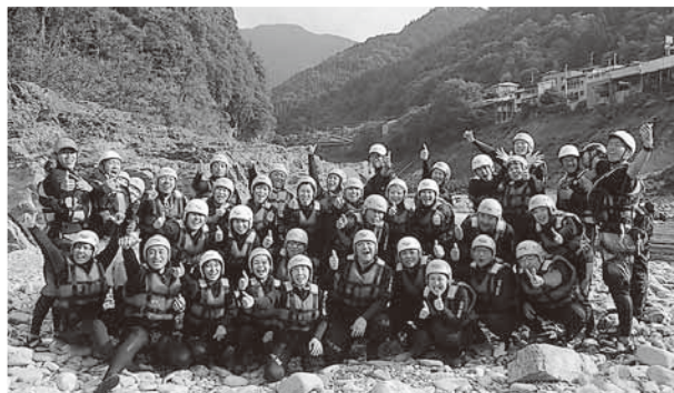
ツアーの最後に参加者みんなで「ラフティング最高!!」

9月20~21日、府職労ラフティングツアーを徳島県吉野川で開催しました。吉野川は利根川(坂東太郎)・筑後川(筑紫次郎)と並び「四国三郎」の異名をもつ日本三大暴れ川の一つであり、一級河川ではもっとも水がきれいな川とも言われています。風が少し冷たくなりつつある時期でしたが、ラフティングに臨んだ21日はいい天気に恵まれ、絶好のラフティング日和となりました。