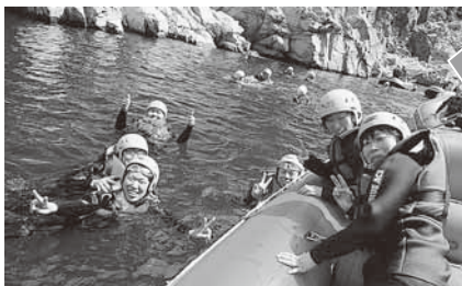
途中で水遊び、飛び込みやすべり台など楽しいイベントもいろいろ