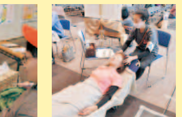
脳のデトックス体験