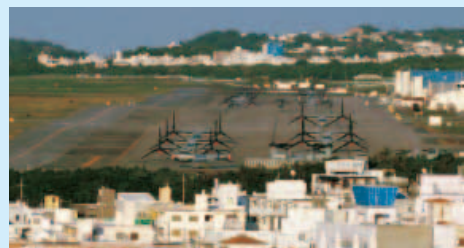
住宅街のど真ん中に駐機するオスプレイ（普天間基地）

に集まってきて、威嚇するような警告をしてきました。 夜は、沖縄・名護市役所で働く青年やオスプレイパッドの建設が進行されている高江で暮らす青年たちと交流し、バーベキューやキャンプファイアを楽しみました。 ツアー2日目は、沖縄県東村・高江の米軍の北部訓練場を訪問しました。3日前にオスプレイが墜落したことを受けて、多くの住民が集まり、抗議集会が開催されていました。全国から多くの仲間も駆けつけ、オール沖縄の国会議員（系数