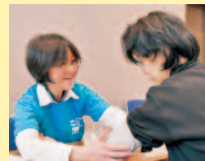
保健所支部の血圧測定・ 健康相談