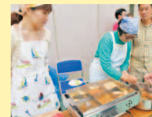
保健所支部・商工労働支部のおでん