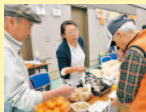
農民連の農産物直売