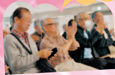
ヒロさんのステージで大爆笑!!