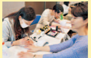
ジェルネイル体験