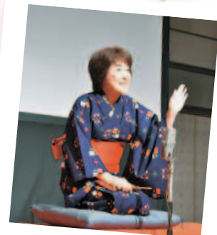
夜勤亭ぐうぐうさ んの創作落語