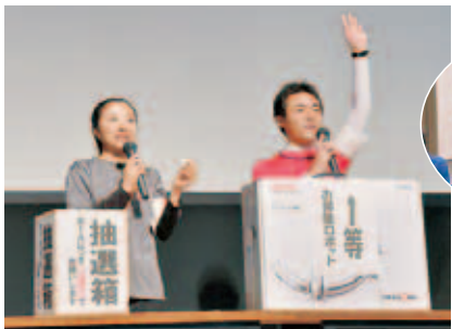
お楽しみの大抽選会