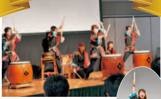
「轟」による太鼓演奏で元気よくオープニング