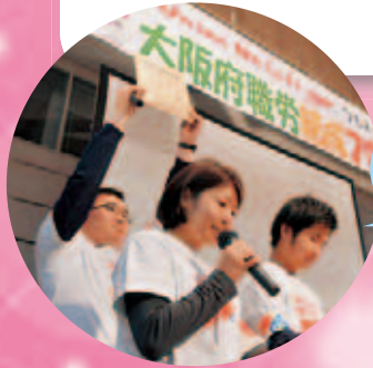
若手が司会を務め、元気の出るまつりに！