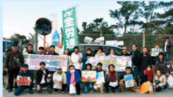
オスプレイ墜落事故に対する抗議集会（高江・北部訓練場）