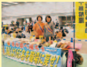
JAL不当解雇撤回 争議団の物販