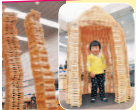
板カプラで遊ぼう