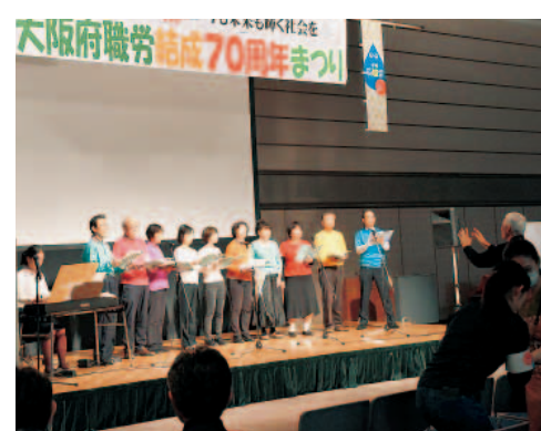
府庁うたごえ合唱団による合唱