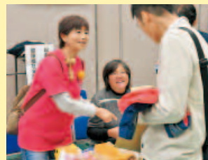
総務農林支部・健康福祉支 部のパンとワインセット