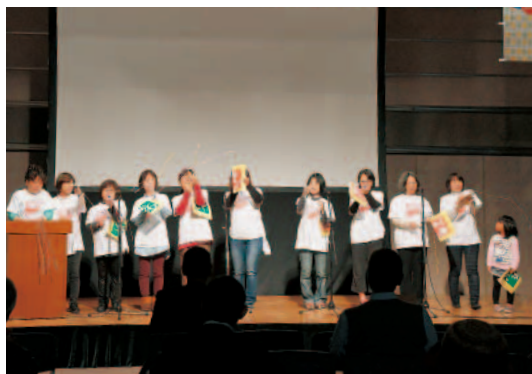
女性部による憲法の朗読