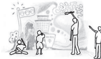
アートプロジェクト「えがく、こえ」